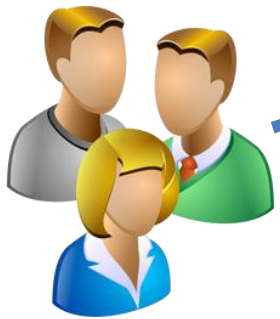
Usuários da Secretaria