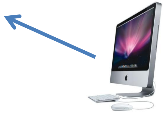
Sistema de Avaliação on-line