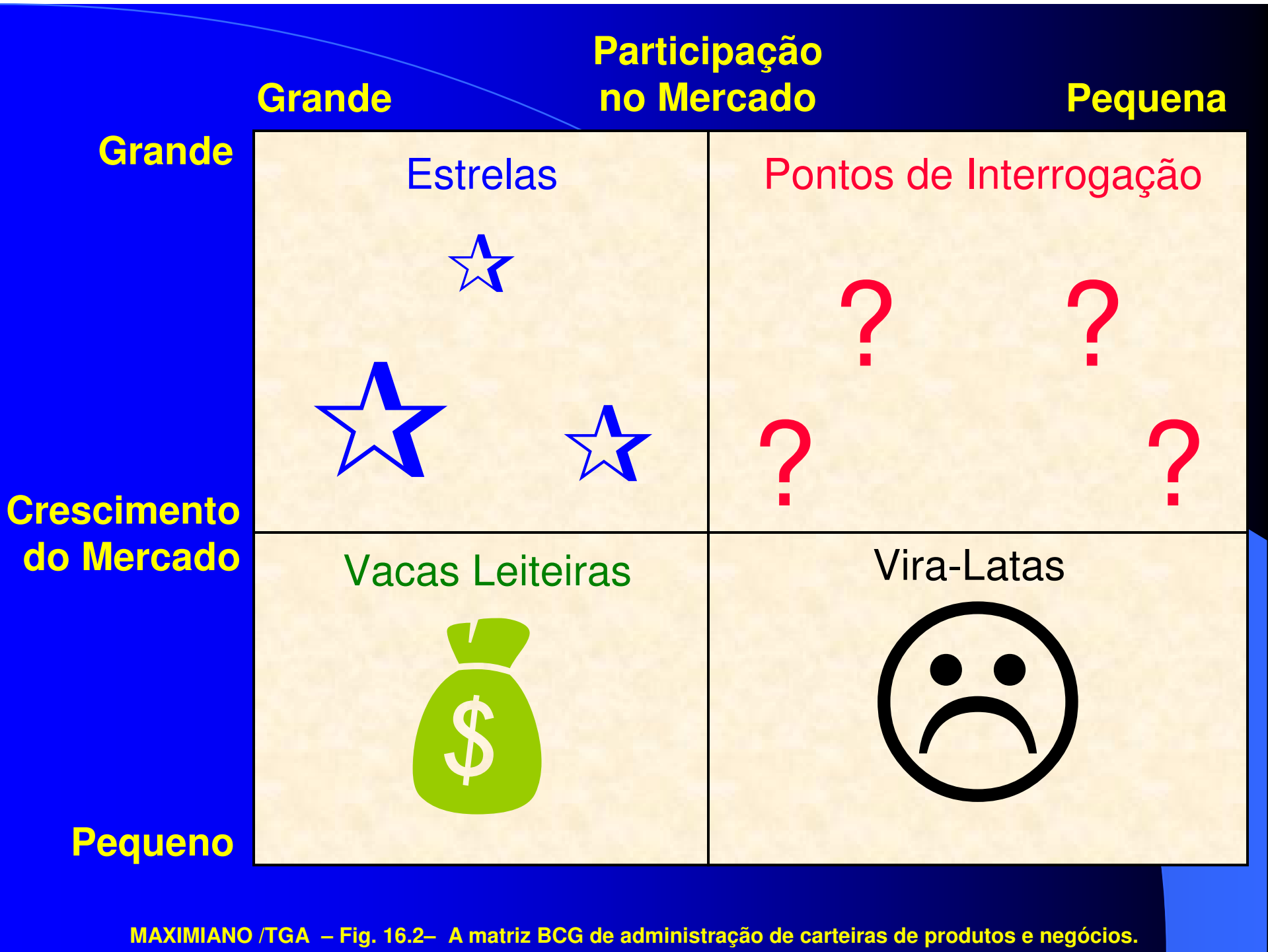
MAXIMIANO /TGA – Fig. 16.2– A matriz BCG de administração de carteiras de produtos e negócios.